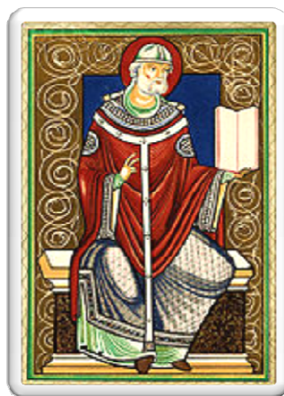
Papa Gregório I com o Oficium na mão.

Durante o Renascimento ( séc. XV e XVI ), apesar de algum desenvolvimento, a música instrumental serve basicamente para acompanhar ou reforçar os géneros vocais. Praticamente não se escreve música para instrumentos.