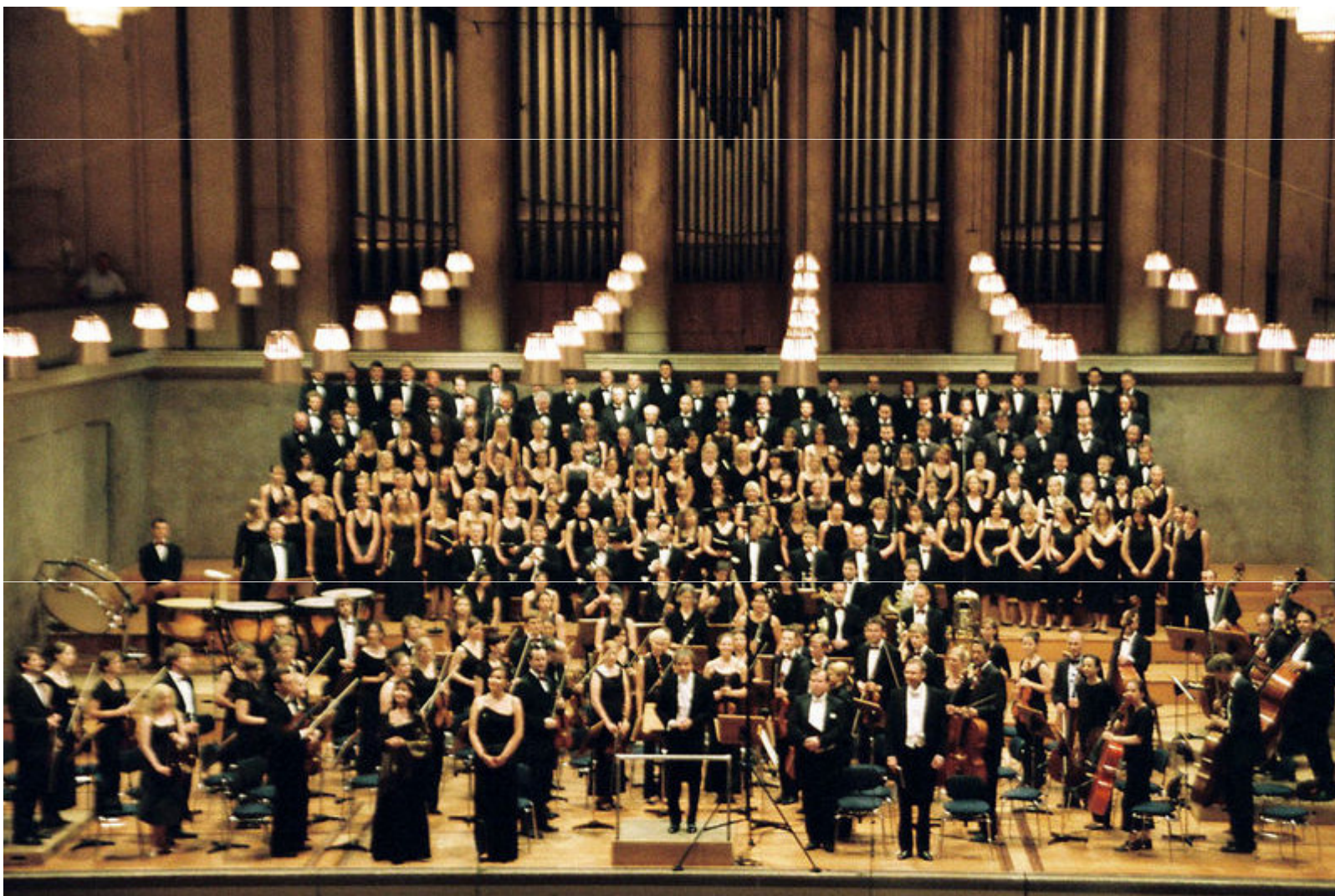
A Orquestra Filarmónica de Viena depois da execução da Nona Sinfonia de Beethoven

No séc. XX são incluídos novos instrumentos de percussão, xilofone , vibrofone e congo , para além de instrumentos específicos como a celasta , as ondas Magenot ou até o sintetizador .